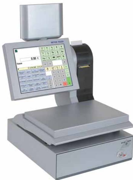
Foto: UC3-RTT-A con cassetto portamonete opzionale