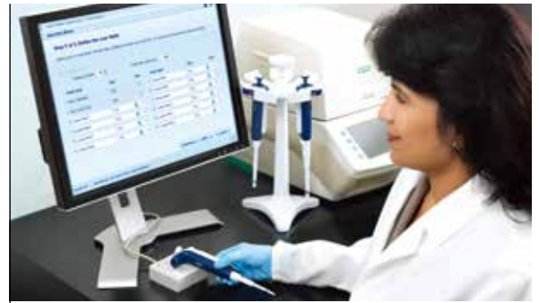
RFID 리더 옵션은 Rainin의 모든 RFID-활성화된 파이펫과 함께 작동하며 METTLER TOLEDO의 LabX™ Direct Pipette-Scan™ 교정 검사와 접속이 됩니다.