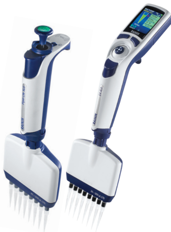
Modelli Pipet-Lite XLS+ e E4 XLS+

Le pipette elettroniche multicanale E4 XLS+ Rainin consentono di lavorare con le piastre in modo più rapido. Le modalità special velocizzano il trasferimento di più aliquote, ottimizzano l'esecuzione di diluizioni in serie e consentono di pianificare una serie di trasferimenti in tempi più brevi.