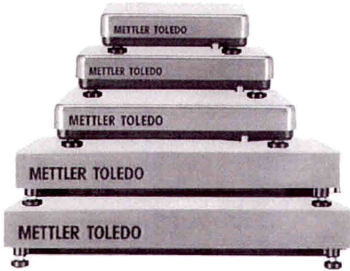
Typical model PBD655 / Modèle PBD655 typique