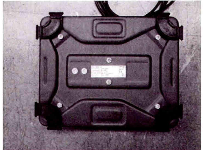
Typical frame of model PBD655 for capacities up to 50 kg (100 lb) / Châssis de modèle PBD655 typique pour les charges allant jusqu'à 50 kg (100 lb)