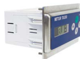
PTPN用 アダプタプレート付きIND331

*Class 1 (cyclic) およびClass 3 (discrete) またはexplicitメッセージ送信に対応可