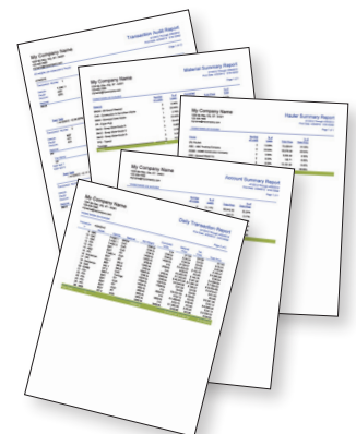
Aussagekräftige Berichte Erstellen von Übersichten mit nur einem Klick