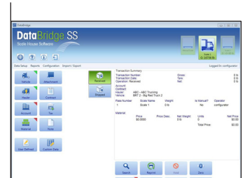
Benutzerfreundliche Oberfläche Touchscreen-Funktionen