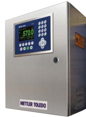
IND9US con terminal IND570 LS