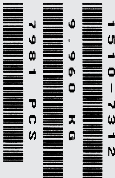
Exemple d'étiquette (échelle 1:1)

Pieces 7981 Pcs NET 9.960 kg TARE 3.225 kg