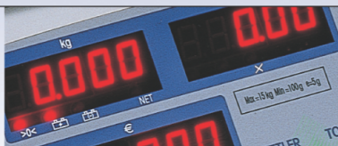
Visualizzazione a LED luminosi per una lettura sempre ottimale.