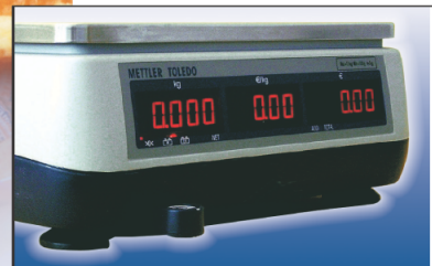
Visualizzazione lato cliente: tutto in un solo colpo d'occhio!