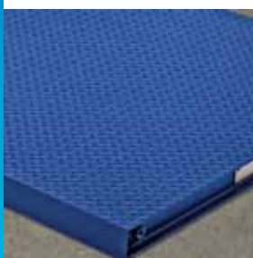
Lámina Corrugada de Seguridad

La báscula de piso PFA261 es de fabricación robusta para usarse en aplicaciones de pesaje general. Es ideal para instalaciones de despacho y recepción o de manufactura general.