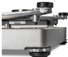
BC 秤配有可调节的限位保护

在包裹快递行业，对设备的要求都非常的苛刻。BC 秤采用全金属框架结构，具有出色的过载保护功能，是您的理想之选。即时过载 5 倍量程的物品，对它的性能也不会有丝毫的影响。