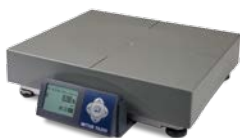
配有塑料秤盘的 BC-30U 或 BC-60U