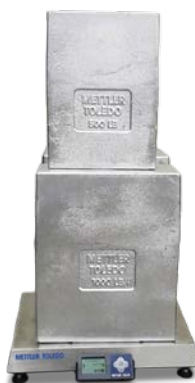
BC 秤在五倍量程的条件下进行测试