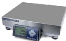
配有不锈钢秤盘的 BC-30U 或 BC-60U