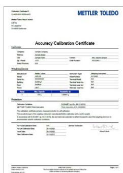
Accuracy Calibration Certificate (ACC) – Certificação de Calibração Precisa