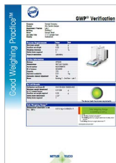
Процедура GWP® Verification