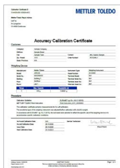
Сертификат Accuracy Calibration Certificate (ACC)

Процедура GWP® Verification позволяет установить надлежащую периодичность калибровки и проверки рабочих характеристик в соответствии с вашими условиями и рисками, присущими конкретной области применения. Клиент получает график калибровок и регулярных тестирований, а также указания относительно методов регулярного тестирования, периодичности, масс гирь и допусков. Подробнее на сайте: www.mt.com/gwp-verification