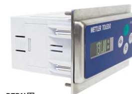
PTPN用 アダプタプレート付きIND331

*Class 1 (cyclic) およびClass 3 (discrete) またはexplicitメッセージ送信に対応可