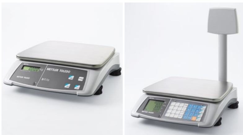
bRite Weigh Only

A mérleg alján elhelyezett két ergonomikus fogantyú valamint a készülék rendkívül könnyű súlya megkönnyíti a szállítást, míg a csúszásgátló gumi talpak egyszerűvé teszik a szintezést valamint megakadályozzák, hogy használat közben a mérleg elmozduljon.