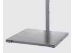
Placa de carga