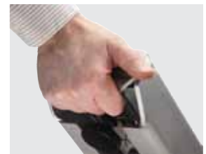
Manija de levantamiento integral