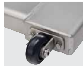
Paquete de rueda