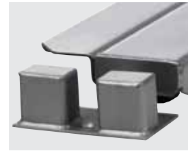
Protección contra choques