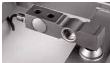
La cellule dynamométrique