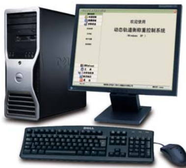
计算机及称重软件