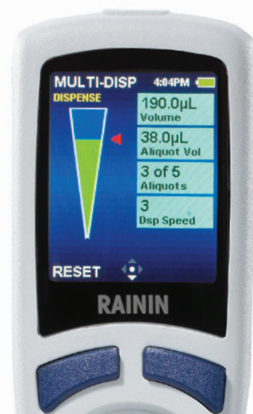
E4 XLS+ en modo multidosisación